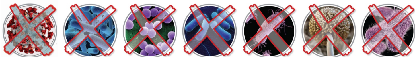
Covid-19, Staphilococcus aureus, Listeria monocytogene, Escherichia Coli, Pseudomonas, Aspergillus Brasilensis, Salmonella